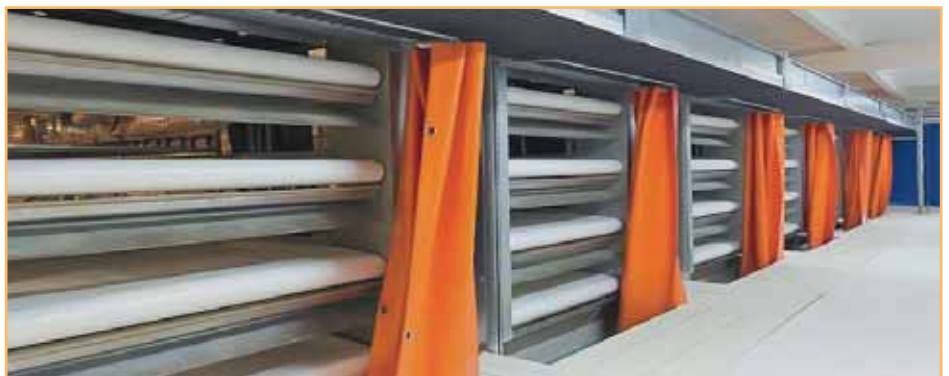
Фото 4. Транспортировочный лифт — автоматическая транспортировка птицы на погрузочную платформу

Транспортировочный лифт доставляет бройлеров до погрузочной платформы, которая устанавливается на уровне соответствующего яруса. В за-