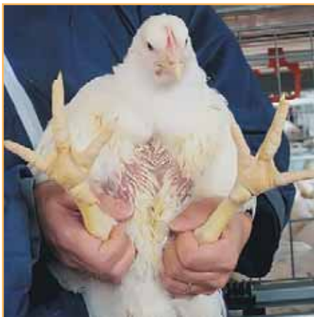
Фото 3. Упругая пластиковая сетка предотвращает образование мозолей на грудке, незначителен риск повреждения кожных покровов ступней

• упругая пластиковая сетка предотвращает образование мозолей на грудке, незначителен риск повреждения кожных покровов ступней (фото 3).