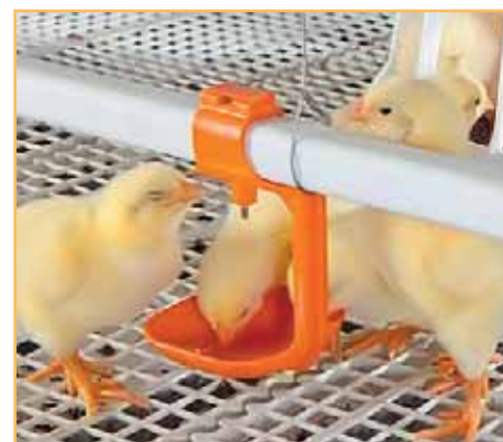
Фото 1 и 1а. Кормовые линии и линии поения оснащены центральным регулирующим механизмом, что позволяет оптимально регулировать их высоту согласно размеру птицы и с минимальными затратами труда