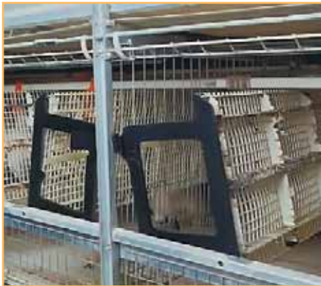
Фото 2. Откидной пол с пластмассовой решеткой гигиеничен и эластичен